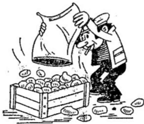
kartupeļu maiss картофельный мешок