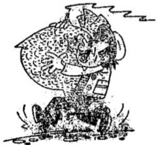
maiss kartupeļu мешок картофеля